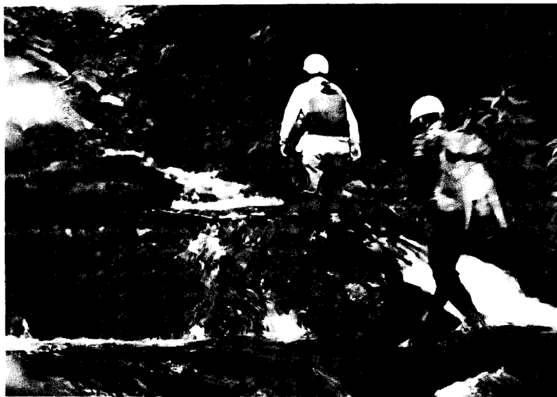
小野川左俣の遊行