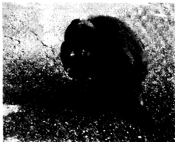
国道上で見かけたニホンザル

ぼ同じ所である。一一頭が視認できた。断定はできないが、朝方会ったのと同じ群れではないかと思う。トチの実やドングリを一生懸命食べていたようだ。(記・一・文)