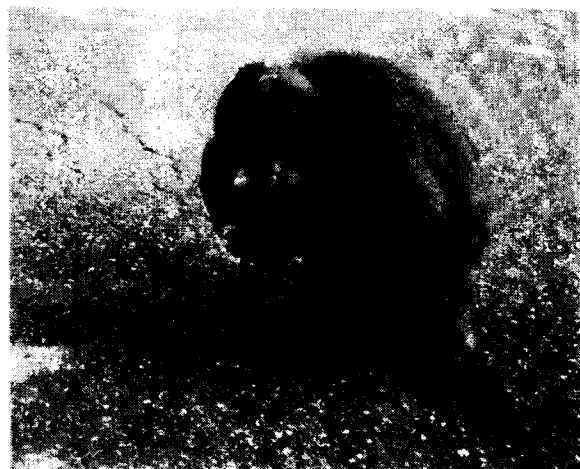
国道上で見かけたニホンザル

ぼ同じ所である。一一頭が視認できた。断定はできないが、朝方会ったのと同じ群れではないかと思う。トチの実やドングリを一生懸命食べていたようだ。(記・一・文)