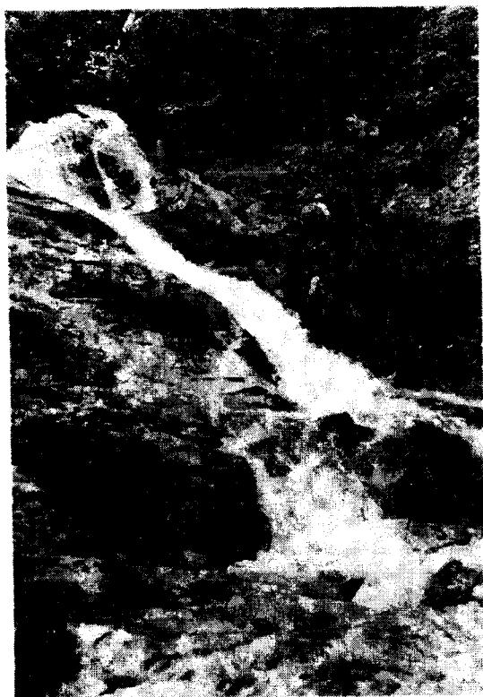
中津川右俣：滝も楽に越してゆけた