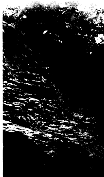
帰路は懸垂下降の連続となった(カモシカ沢)

大滝沢本流に落ち込むF1はフリクションをいっぱいきかせて登り、最後の方は右側のブッシュをぞいににげる。直登できないものかと上からザイルで確保してもらいな